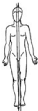
Рис. 1. В энергетической системе человека проходят два основных потока энергии – из Земли (снизу – вверх) и из Космоса (сверху – вниз).

У каждого человека семь основных чакр. Они расположены вдоль позвоночника, и каждая из них связана с определенными внутренними органами. Вся жизнь человека: его физическое здоровье, карьера, материальное благополучие, удача, семейное счастье – напрямую зависит от того, хорошо ли работают его чакры.